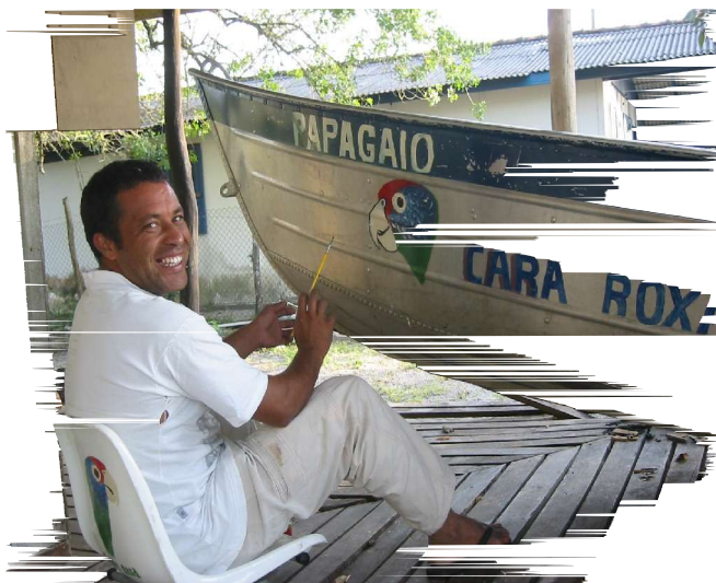
Foto1 – Barco do projeto sendo caracterizado

A primeira novidade que queremos contar é que o projeto adquiriu um barco a motor. Este meio de locomoção está facilitando muito a realização das atividades de pesquisa e de educação ambiental nas ilhas de Guaraqueçaba. O nosso barco já foi batizado com o nome de papagaio-de-cara-roxa e foi caracterizado por um artista, morador da Ilha das Peças, com desenhos de papagaios.