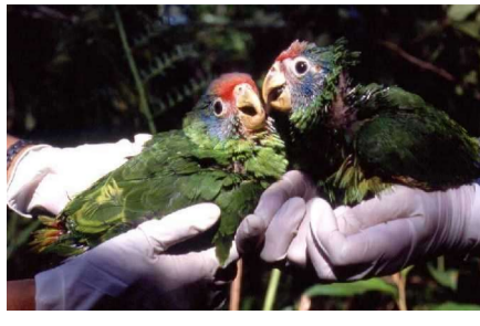
Foto 1- Filhotes de papagaio-de-cara-roxa monitorados pela equipe do projeto

O Projeto de Conservação do Papagaio-de-cara-roxa acompanha, desde de 1998, o período reprodutivo do papagaio-de-cara-roxa no litoral do Paraná. Vários sítios (locais onde vivem os papagaios) são conhecidos e acompanhados pela equipe do projeto, todos em ilhas da baía de Paranaguá e Guaraqueçaba.