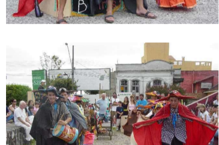
Foto 3 e 4 – Apresentações da peça Auto de Guaqueçaba em Curitiba

A história da peça, que foi uma criação coletiva após um ano de trabalho, gira em torno das aventuras vividas por animais da floresta para resgatar uma papagaia-de-cara-roxa seqüestrada na festa de seu casamento.